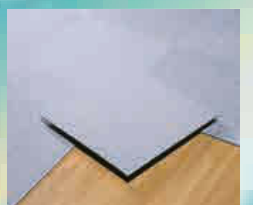
タイルカーペット