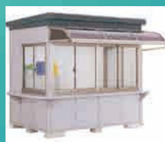
テラス・外カウンター

※換気扇、エアコン、陰圧空気清浄機、殺菌灯、抗菌コート、検査グローブ付ホールガラスなどは別途ご手配ください。また、電源工事は電気工事士にご依頼ください。