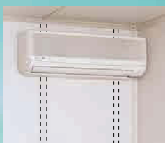
エアコン取付支柱