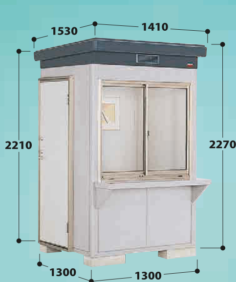
※外カウンターはオプション SMK-17SGM